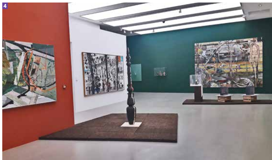
1 Immersion olfacto-sonore, mêlant bruits d'insectes et parfum d'orchidée sauvage... L'opéra de la pollinisation croisée : pour Catherine Petitgas, 2019, Oswaldo Maciã 2 Untitled, 2013, sculpture organique de Maria Nepomuceno