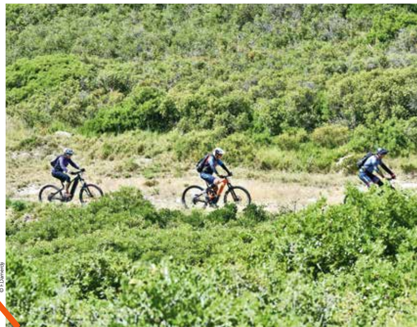
S'oxygéner à pied et à vélo, avec des balades en pleine nature.

Cournonsec, Cournonterral, Pignan, Fabrègues, Lavérune. La plaine de Fabrègues s'étend sur 3 300 ha. Un territoire délimité par la montagne de la Moure, le massif de la Gardiole et bordé par la ripisylve de la Mosson et l'étang de Thau. Ce site naturel classé Natura 2000 s'inscrit dans le réseau des sites remarquables d'Europe, identifiés pour la rareté ou la fragilité des espèces qu'ils abritent et leurs habitats. Car dans cette plaine fertile dominée par la vigne et ponctuée de haies et de bois nichent des espèces d'oiseaux à forte valeur patrimoniale. Cette zone d'intérêt ornithologique accueille une des dernières populations de la pie-grièche à poitrine rose qui a fortement régressé en France, le rolhier d'Europe, l'une des dernières populations languedociennes et l'outarde canepetière, espèces essentiellement cantonnées dans les plaines méditerranéennes.