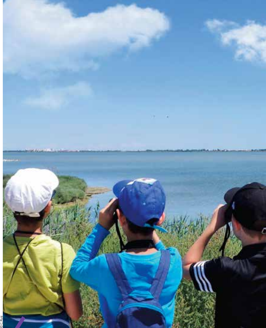
La boucle de la réserve du Méjean, avec sa flore et sa faune typiques des étangs.