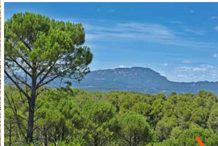
Vue panoramique sur le poumon vert de la métropole.