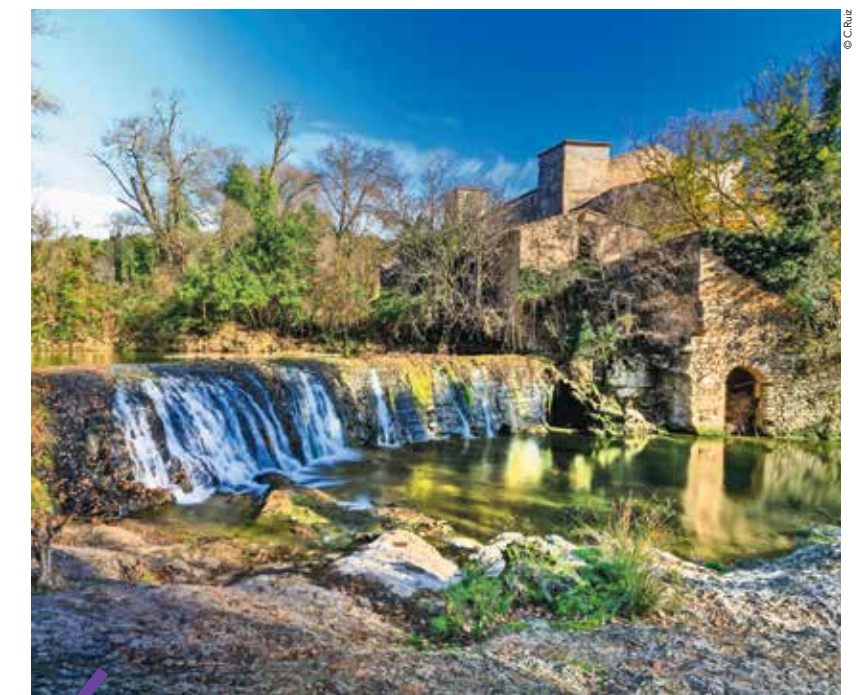
La source de l'Avy, également appelée Lou dragas (le dragon), symbole de Grabels.

L'Oasis des garrigues, c'est une boucle de 12 km, homologuée Promenade et randonnée par la Fédération française de randonnée (3 h 30, niveau moyen). Le circuit a été aménagé sur un site de légendes à redécouvrir. Départ de la source de l'Avy, lieu calme et bucolique et oasis de fraîcheur en été, qui est dénommée Fesses de Madame en raison de la forme de ses roches. Résurgence d'une rivière souterraine longue de 200 m, l'Avy est un affluent de la Mosson. La promenade suit ses berges, puis grimpe jusqu'à la Croix de Guillery, point culminant qui offre une vue panoramique de Grabels. Le circuit passe ensuite par le Redonnel pour atteindre le Domaine Maspique, puis prend à nouveau de la hauteur en continuant de l'autre côté de la commune, sur le plateau de la Goule de Laval, avant de redescendre vers le village. Une partie de ce tracé, de plus de 259 m de dénivelé, situé sur le chemin de Saint-Jacques-de-Compostelle, traverse des paysages de garrigues, vignes, plaines et offre un splendide point de vue sur l'Hortus.