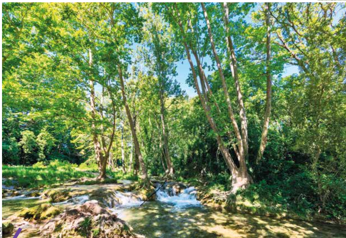
Forêt-galerie, sentiers escarpés, falaises, cascades... à Montpellier, au cœur de la réserve-naturelle du Lez.

Qui pourrait imaginer pareil paysage à 3 km à vol d'oiseau du centre-ville de Montpellier ? La balade de la réserve naturelle du Lez débute à proximité d'Agropolis. L'accès à ce site de 20 ha est libre, mais s'effectue selon des horaires réglementés, car le secteur est classé en zone protégée Natura 2000. Le sentier sinue en bordure du Lez. Tout autour, la ripisylve, la végétation spécifique des cours d'eau, mêlée aux liquidambers, noyers d'Amérique, ormes du Caucase, séquoias, orangers des Osages, arboretum planté par des botanistes au XIX e siècle. Ce corridor écologique est l'habitat naturel du chabot du Lez, petit poisson endémique, uniquement présent dans le fleuve, mais aussi du blageon, du toxostome, de la tortue d'eau douce appelée cistude d'Europe, de libellules comme l'agrion de Mercure et la cordulie à corps fin. Tous sont protégés en raison de leur rareté.